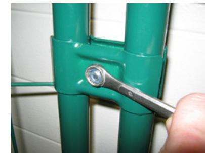
Kiinnityskappale kiinnitetään 13 mm:n kiintolenkkiavaimella tai räikällä.