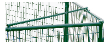
Iso tai monimutkainen tarha voidaan tukevoittaa lisävarusteena saatavilla Jämpti Pro Kulmatuilla.