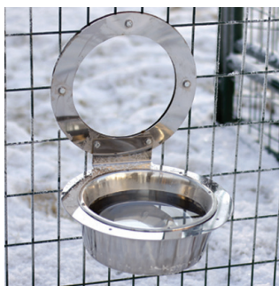
50045 | 50046